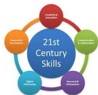
HABILIDADES DEL SIGLO XXI