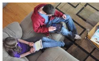
APRENDIZAJE A TODA HORA Y EN TODO LUGAR